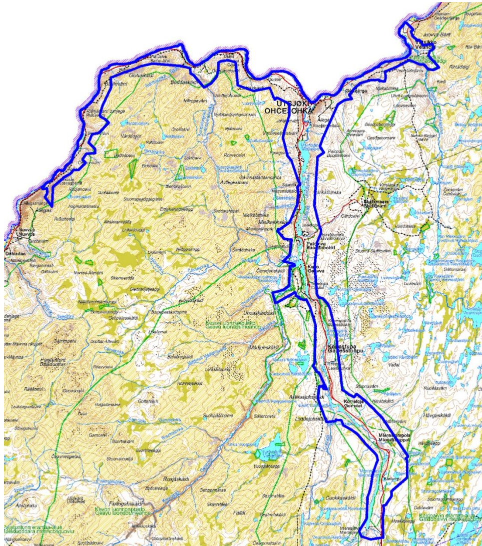
Govva: Ohcejoga oasseguovllu oasseoppalašlávvaovllu ráját.